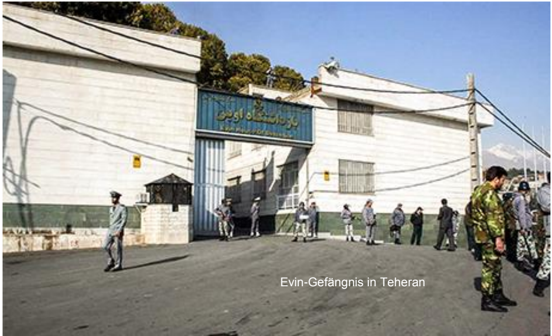
Evin-Gefängnis in Teheran