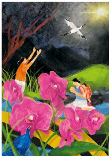
Das Titelbild zum Weltgebetstag 2023 stammt von der Künstlerin Hui-Wen Hsiao. Die Frauen auf dem Gemälde sitzen an einem Bach, beten still und blicken in die Dunkelheit. Trotz der Ungewissheit des Weges, der vor ihnen liegt, wissen sie, dass die Rettung durch Christus gekommen ist.

Über Länder- und Konfessionsgrenzen hinweg engagieren sich Frauen seit über 100 Jahren für den Weltgebetstag.